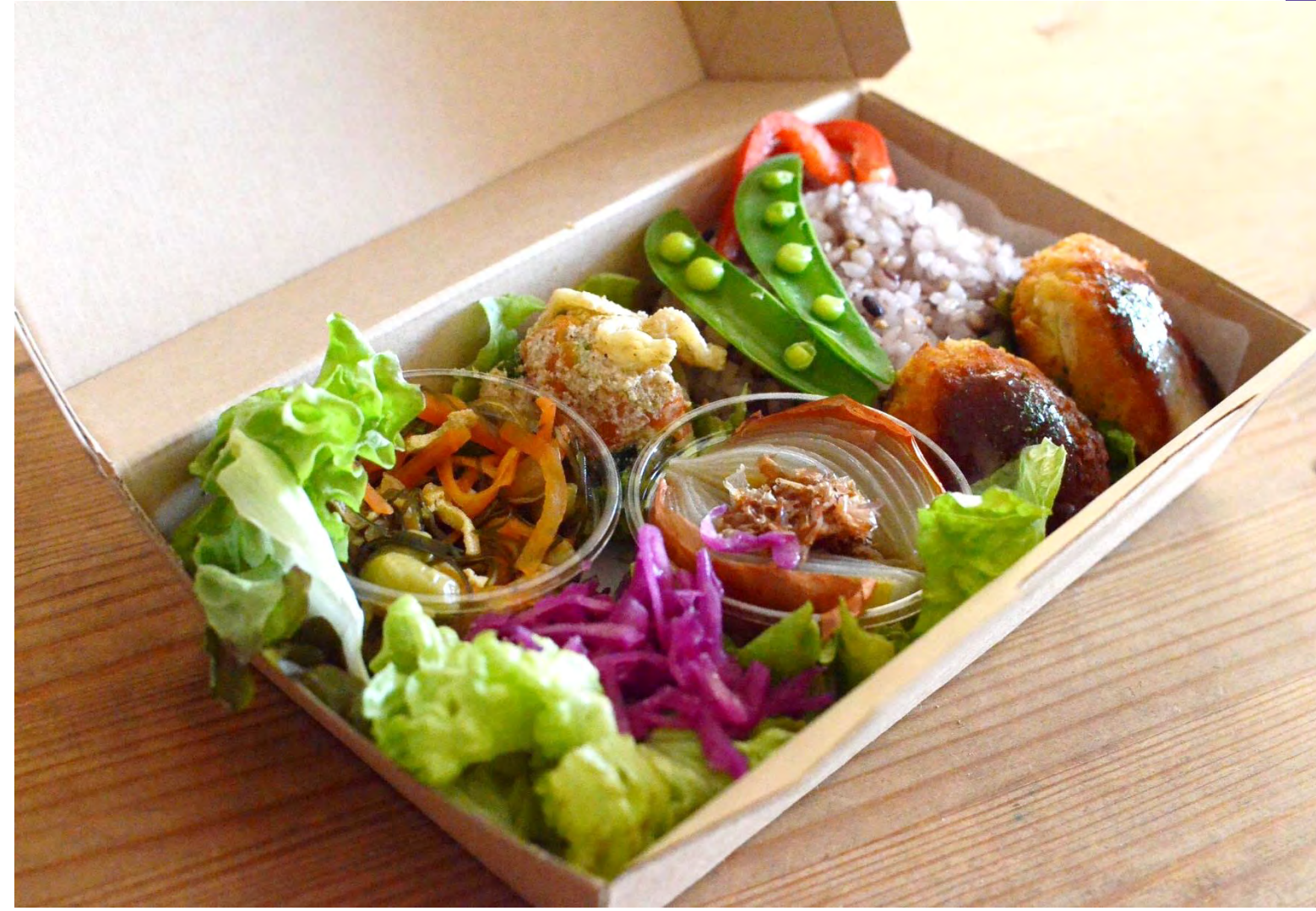
※写真はイメージです、内容は季節により異なります