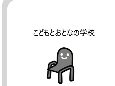
子どもとおとなの学校