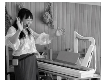
心にひびくハーブとピアノの生演奏♪