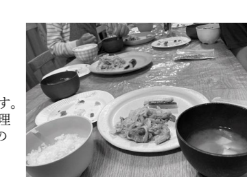
みんなで作った料理を一緒にいただきます😊