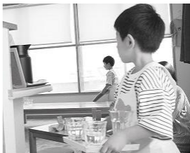
子どもの「やってみたい」を応援します♪